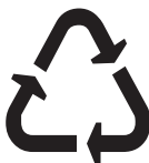
Перерабатываемый пластик Этот знак ставится на пластиковых изделиях, которые могут быть переработаны промышленным способом