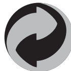
"Зеленая точка" Знак ставится на свою продукцию компаниями, которые оказывают финансовую помощь германской программе переработке отходов "Eco Emballage" (Экологическая Упаковка)