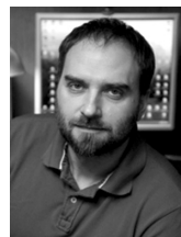
Анашвили Валериан Валерианович