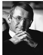
Манфред Кетс де Врис