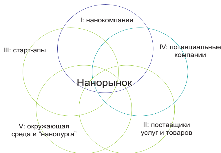
Рис. 2. Модель российского нанорынка

Агенты рынка поделены на пять категорий: