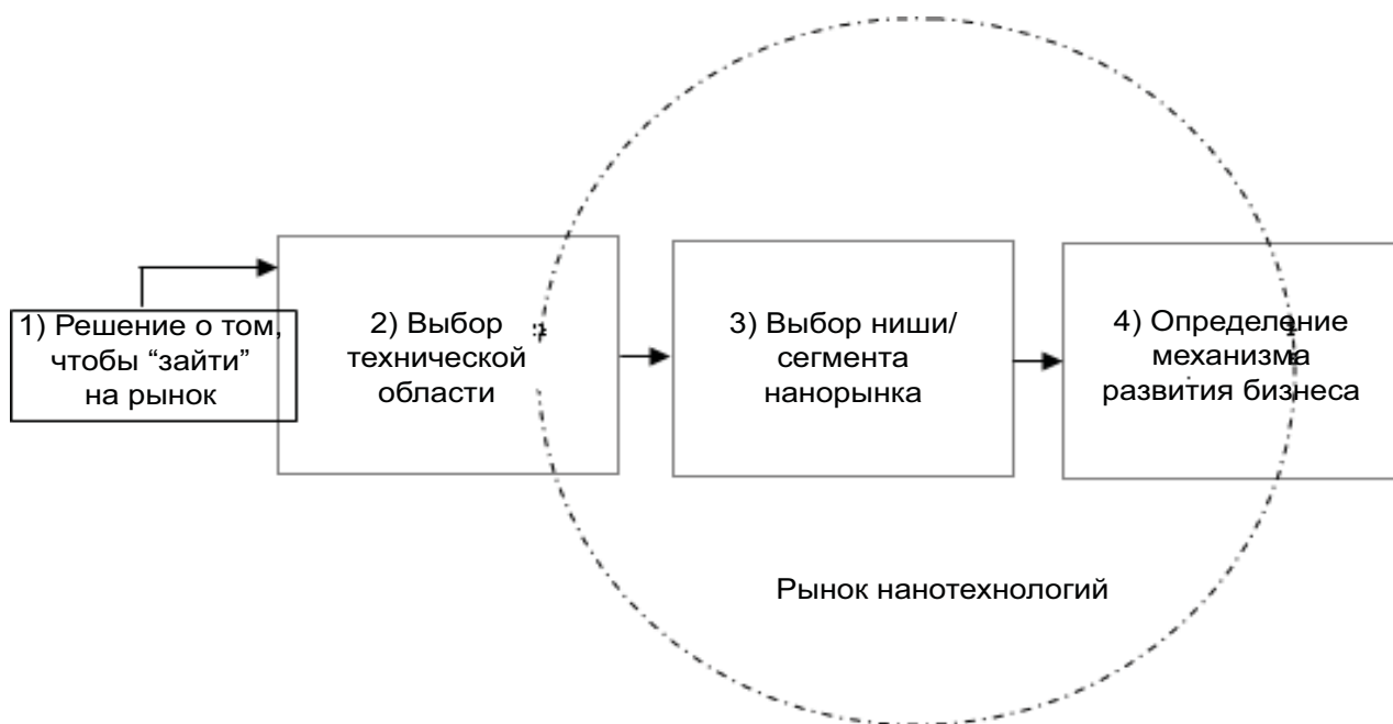
Рис. 1. Схема стратегии поведения нанотехнологической компании

Для нашего исследования полезно было выделить именно эти блоки, которые нужно разложить более подробно. Блок 1 состоит из трёх элементов (были сформулированы в виде вопросов, которые руководители фирм должны задать себе):