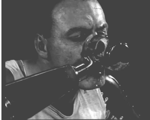
Ил. 8. Фильм демонстрирует изобилие специальных приспособлений, ввинчивающихся в протез и используемых как в работе, так и для восстановления сил (кадр из фильма «Миллион двести тысяч»).