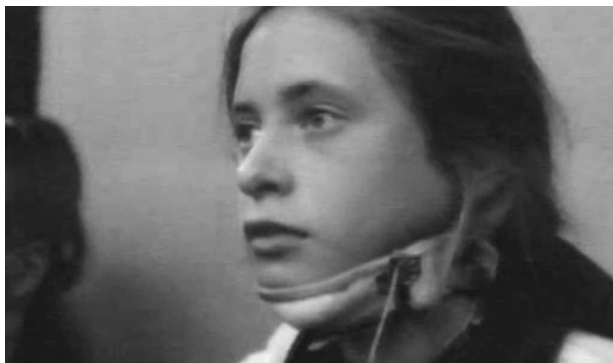
Ил. 16. Кадр из фильма «Это было у моря».

[1989]) – юные воспитанницы интерната для детей с большим позвоночником, где они проходят обследование и лечение. Гимнастика, фиксирующие корсеты, ежевечерний обязательный просмотр программы «Время», всевозможные запреты, плотный неусыпный контроль... Интернат, как и любое другое закрытое учреждение, работает здесь как метафора несвободного общества, с его жесткими категориями правильных и ненормальных, красоты и уродства, чистоты и опасности. И хотя в кадре исключительно привлекательные девочки-подростки, чьи проблемы становятся заметными лишь с надеванием на них медицинских приспособлений (Ил. 16), ребята из мореходного училища, приглашенные на танцы в интернат, избегают своих сверстниц в специальных белых воротниках: «А что, у вас тут все в намордниках?».