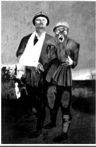
Ил. 2. Изувеченные войной как метафора человеческого бедствия. «Инвалиды войны». Художник Ю. Пименов (1926).

Первая мировая война, покалечившая огромное количество людей, повлияла на распространение сюжетов, связанных с инвалидностью в визуальном дискурсе – как дореволюционном, так и раннем советском.