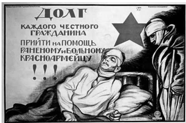
Ил. 3. Инвалиды войны как объекты милосердия и благотворительности. Плакат. Художник А. Апсит (1920).

возможности мобилизовать инвалидов в армию труда. За нэпом последовал первый пятилетний план, с его жестким креном в направлении индустриализации и коллективизации сельского хозяйства.