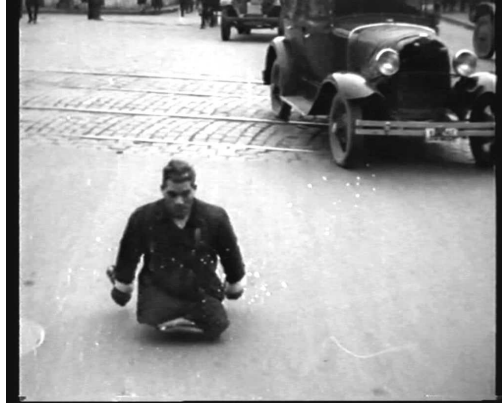
Ил. 5. В этой сцене фактически отсутствует драматургия, режиссер упивается организацией движения (кадр из фильма «Миллион двести тысяч»).

Вскрывая души машин, влюбляя рабочего в станок, влюбляя крестьянина в трактор, машиниста в паровоз, мы вносим творческую радость в каждый механический труд, мы родним людей с машинами, мы воспитываем новых людей, Новый человек, освобожденный от грузности и неуклюжести, с точными и легкими движениями машины, будет благодарным объектом кино съемки. Развинченными нервам кинематографии нужна суровая система точных движений.