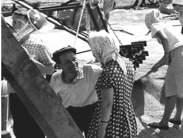
Ил. 13. Кадр из фильма «История Аси Клячиной...» Это реальные люди, а не выдуманные персонажи, они играли в этой картине вместе с профессиональными актерами.

исполнителей; сам режиссер называл его сюрреалистической сказкой в хроникальной манере [А. Михалков-Кончаловский о фильме... 2007].