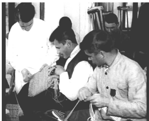
Ил. 4. Фронтовики обучаются плетению макраме (кадр из фильма «Возрождаемые к жизни»).

Формы социальной политики были тесно связаны с политикой стимулирования трудовой деятельности, играя важную роль не только в улучшении трудовой дисциплины, но и в поощрении роста производительности труда. Те трудовые ресурсы, что не находили себе применения в данный конкретный момент, по сути, оставались активной рабочей силой завтрашнего дня. Они были «резервной армией труда»