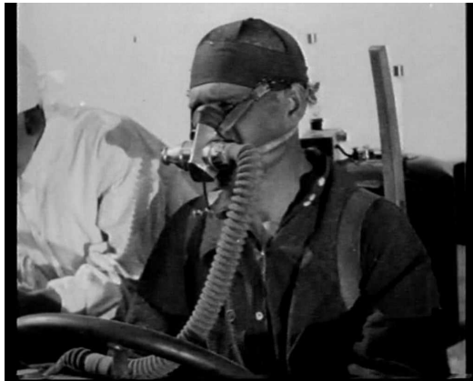
Ил. 6. «Инвалидное» тело как объект исследований, медицинской экспертизы (кадр из фильма «Миллион двести тысяч»).

Но подлинное единение человека с машиной нас ждет в следующих частях картины – работа на станках, на конвейерной линии, тестирование функций тела при помощи медицинских приборов ( Ил. 6 ).