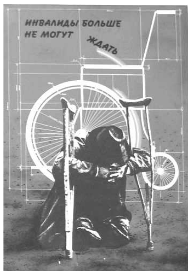
Ил. 14. Художник О. Качер «Инвалиды больше не могут ждать». Плакат (1988). Инвалид изображен в ожидании коляски – вместо костылей?

Некоторые фильмы об активности инвалидов («Взгляд» [1987], «Поздний восход» [1990], «Сотвори себя» [1991]) раскрывают достижения и внутренний мир спортсменов или художников среди инвалидов, однако и они, и ряд других работ по-прежнему используют знакомые паттерны, показывая «сентиментальную, пропитанную национальным духом агиографию героического страдальца. Только железный человек может выжить, пройти через то, что ему довелось, оставаясь примером, вдохновляющим других à la герой-мученик» [Alaniz, 2007], подобно Корчагину, Мересьеву или Воропаеву.