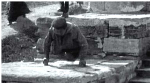
Ил. 1. «Калека» как элемент видового разнообразия «народа». Кадр из фильма «Броненосец Потемкин».

Фактурный персонаж массовки, «народа» (в смысле бедности и в смысле разнообразия) – безногий или инвалид на костылях в толпе. Это «типаж», человек с подходящими внешними данными, но не слишком сильно выделяющийся, а элемент реалистического представления, так как явное физическое уродство портит типажность, это выход за пределы человеческого как типа: