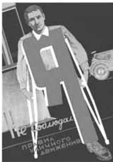
Ил. 9. Инвалид как причина собственных проблем. Неизвестный художник. «Я нарушал правила уличного движения». Плакат 1939 года.

ники / тунеядцы, и понятия коллективной политически правильной идентичности составляют социальный контекст индустриализации и коллективизации, кампаний против уравниловки и других значимых событий эпохи. В картине выведены и образы «плохих» инвалидов – это иждивенцы, живущие на пенсию, пьющие, ведущие асоциальный образ жизни.