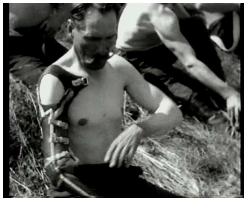
Ил. 7. Раздевание перед купанием. В прошлом инвалиды, ныне – студенты сельскохозяйственного техникума (кадр из фильма «Миллион двести тысяч»).

В следующей части фильма моделируется новый вариант советских крестьян: «Ловкость и скорость должны осваиваться как новые приспособления тела к модернизированному обществу» [Булгакова, 2005. С. 149]. Мужчины на косьбе – это, оказывается, студенты Центрального сельскохозяйственного техникума, они ловко управляют не только с косой, но и с техникой – косилкой, зернопогрузчиком, автомобилем. Их движения тоже напоминают четко отлаженный механизм – и то, как они убирают хлеб, и в других сценах ударного сельского труда, и в том, как маршируют на речку. Это механизированное движение сродни милитаризированному [См.: Сапнер, 2005] (фильм открывается сценой, в которой полк солдат марширует на империалистическую войну). Обнажение мужчин перед купанием говорит здесь не только о смещении границ публичного / частного, характерном для демократического перехода 1920-х годов [Булгакова, 2005. С. 149]. Мужчины снимают рубахи и порты, отстегивают искусственные конечности, которые стали для них своего рода одеждой для работы (Ил. 7).