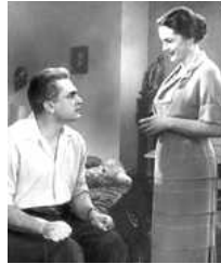
Ил. 10. Визуальное представление утраченной мужественности (Кадры из фильмов «Актриса», «Неоконченная повесть», «Истребители»).