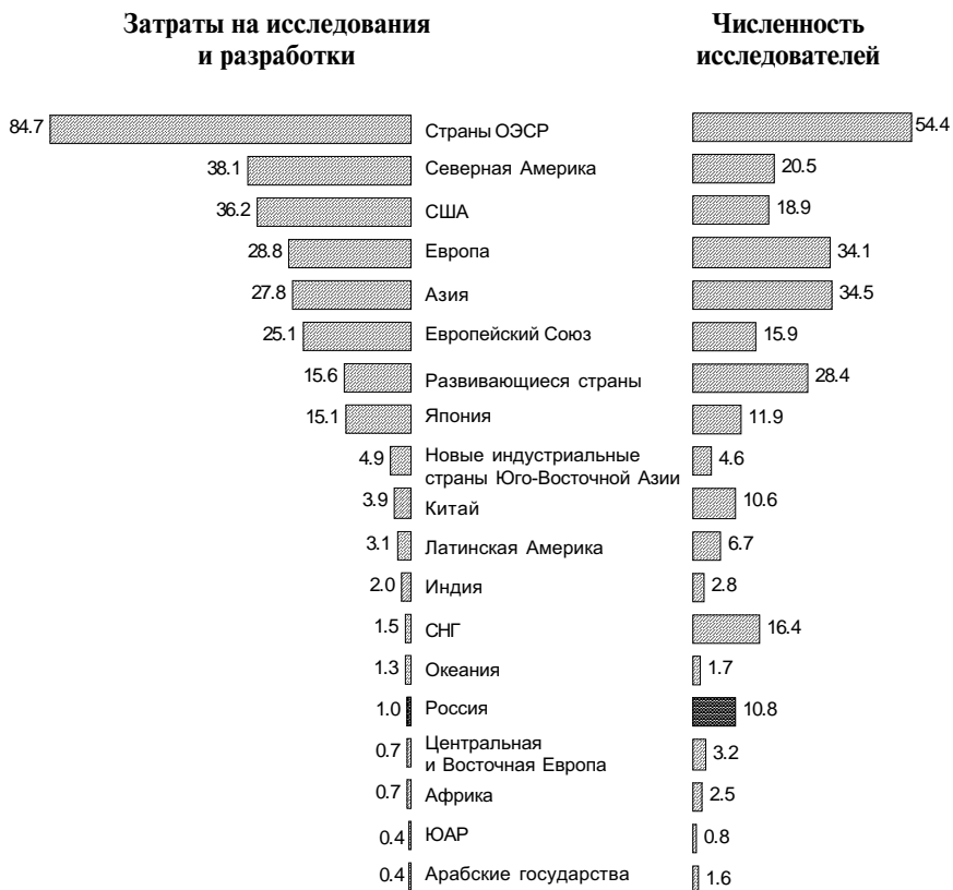
Рис. 2. Удельные веса регионов (стран) в показателях мировой науки, %

В ситуации, когда государство остается крупнейшим спонсором науки в России (56% затрат на исследования и разработки), дальнейшее промедление с ее реформой и распыление ресурсов между многочисленными научными организациями и направлениями могут иметь самые пагубные последствия. К сожалению, действующая практика определения научно-технических приоритетов направлена на поддержание существующих институциональных образований. Базовое финансирование в бюджете науки существенно превышает проектное, т.е. вместо концентрации ресурсов на получении перспективных техноло-