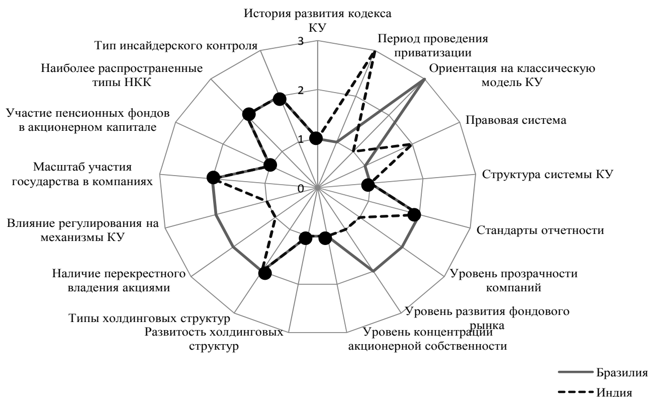
Рисунок 1. Профили моделей КУ Бразилии и Индии.

Прим.: Прямые совпадения – полное совпадения значений параметров в Табл. 1. Косвенные совпадения – условные (близкие по своей сути) совпадения параметров в Табл. 1 (одно косвенное совпадение в количестве совпадению засчитывается с весом 0,5).