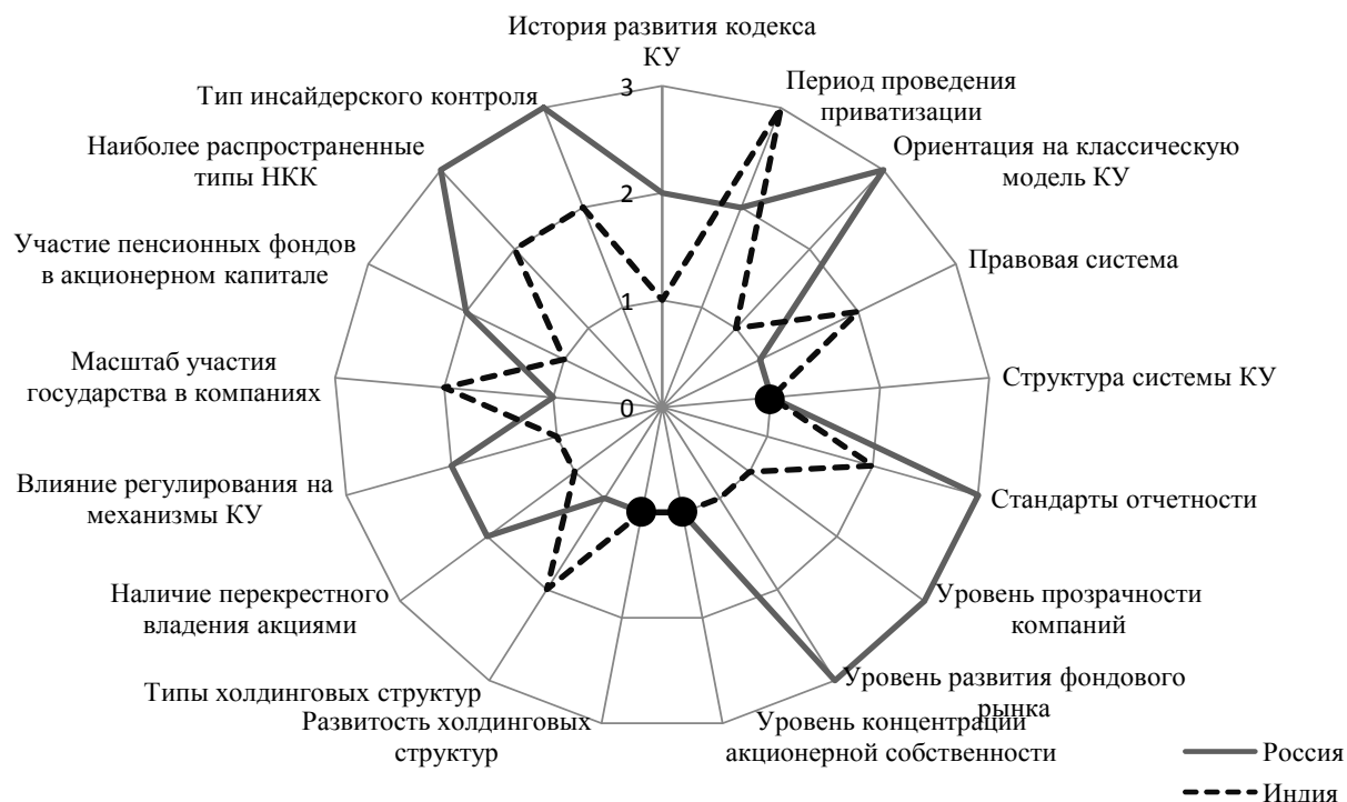
Рисунок 2. Профили моделей КУ России и Индии.

Прим.: ● - точки прямых совпадений характеристик анализируемых моделей КУ.