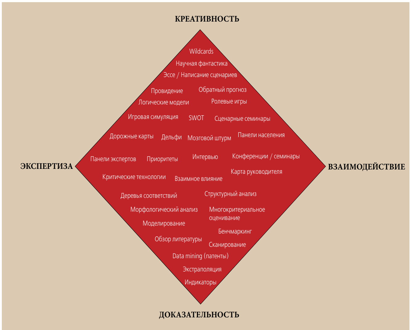
Рис. 2. «Форсайт-ромб»

виде они были представлены в виде двух групп приоритетов в «Комплексной программе научно-технического прогресса СССР». Первая группа включала исследования в области электроники, информатики и вычислительной техники, новых материалов, наук о жизни, научного приборостроения и др. Во вторую группу входили фундаментальные исследования. В начале 1990-х годов, уже в Российской Федерации, работа по выбору научно-технических приоритетов была продолжена, и ее статус поднят с ведомственного до общегосударственного уровня. В 1996 году Правительственная комиссия по научно-технической политике утвердила перечни 10 приоритетных направлений развития науки и техники и 70 критических технологий. В те годы, когда экономика страны находилась в состоянии кризиса, а наука финансировалась по остаточному принципу, научно-технические приоритеты носили достаточно формальный характер, а основной задачей научной политики было сохранение научного потенциала страны.