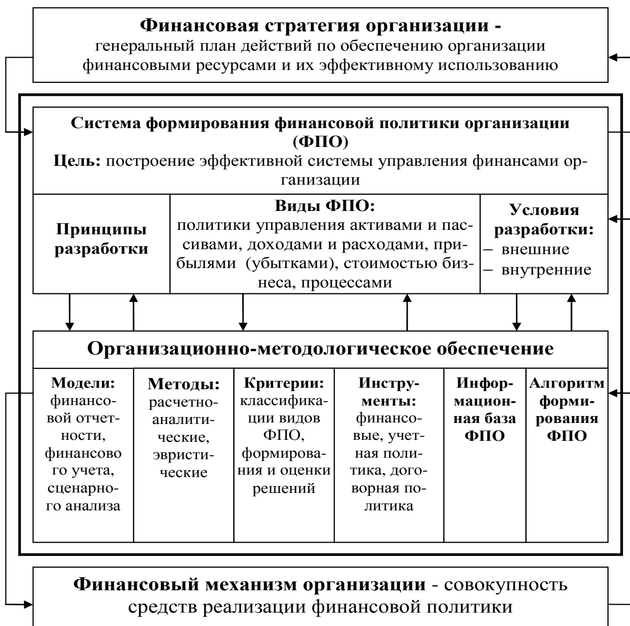
Рис. 2. Концептуальная схема формирования и реализации финансовой политики организации

На рисунке 3 представлена блок-схема рекомендуемой автором последовательности разработки финансовой политики организации и ее видов.