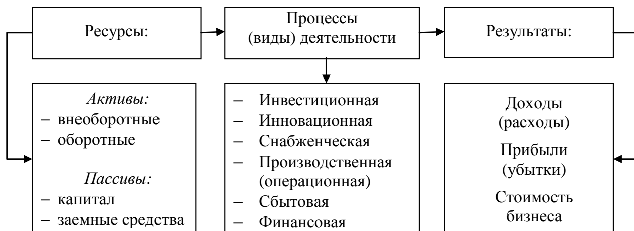
Рис. 1. Объекты финансовой политики организации

Классификация объектов финансовой политики дает возможность конкретизировать ее виды и задачи разработки. Движением финансовых ресурсов, формированием доходов, расходов, прибылей (убытков), изменением стоимости бизнеса сопровождаются операции инвестиционной, текущей и финансовой деятельности организации. В составе текущей деятельности выделяются процессы производства, снабжения, сбыта. Наряду с инвестиционной деятельностью, связанной с разработкой инвестиционных проектов и движением внеоборотных активов, целесообразно выделить процессы, обусловленные внедрением и использованием инноваций. Финансовая деятельность, как известно, не отождествляется с финансово-экономическими процессами и ограничивается, в частности, операциями расчетов по кредитам и займам, с учредителями по дивидендам, эмиссии ценных бумаг.