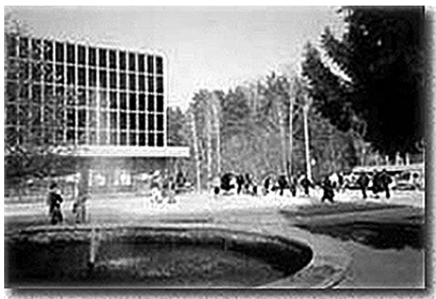
Торговый центр в Академгородке