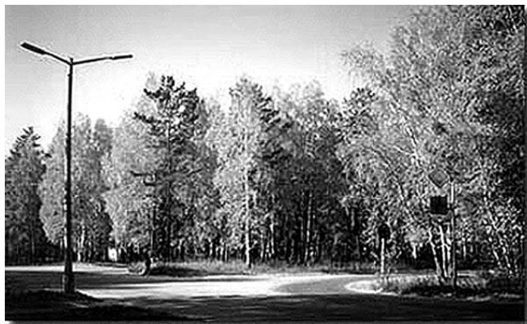
ул. Терешкова в Академгородке

ничения, которые отрицательно сказывались на качестве социологических исследований. Сейчас другая ситуация. Социологические исследования нередко носят промышленно-поточный характер. Массовизация исследовательской деятельности приводит к тому, что ее качество падает. Раньше существовал неформальный отбор тех, кому научная деятельность казалась действительно интересной, она была их призванием. Сегодня же к исследованию относятся так же, как к любому другому занятию. И в конечном итоге уровень современных социологических исследований, как мне кажется, стал все-таки ниже. Во многом это связано с изменением характера науки и общества.