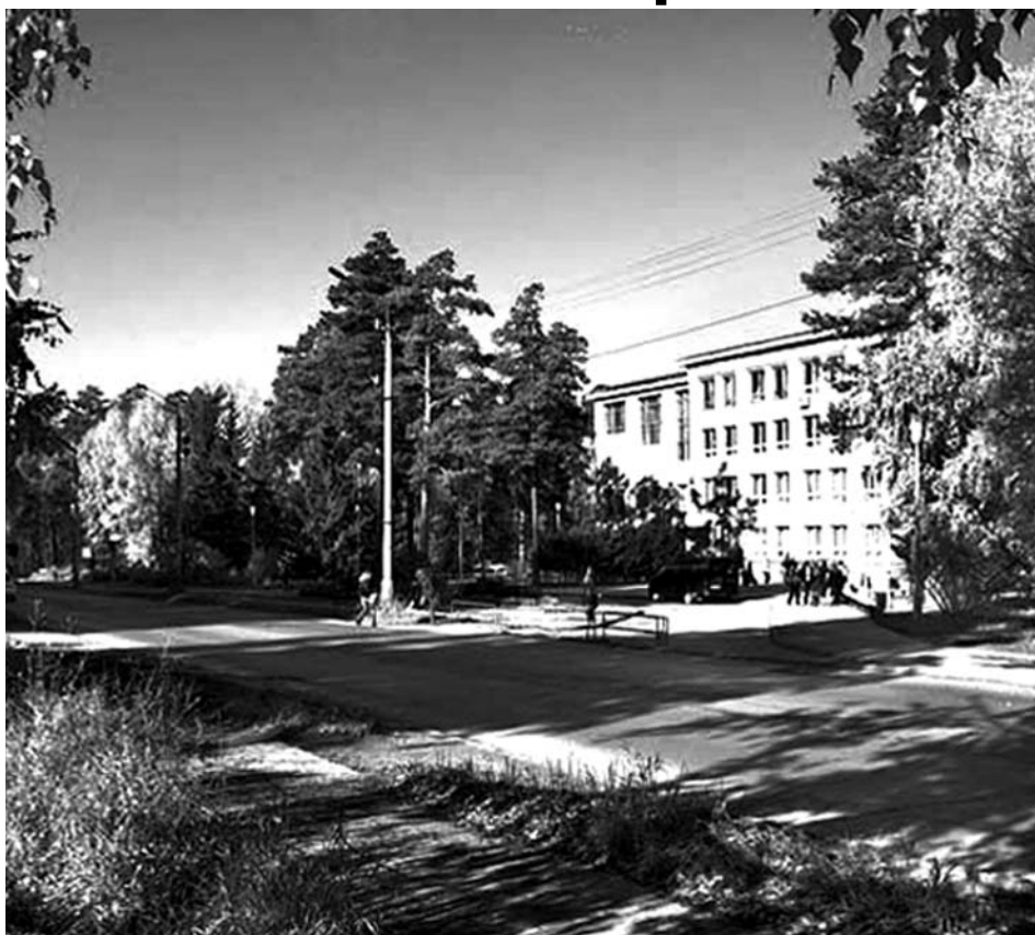
Новосибирский государственный университет

– Социология начала институционализироваться. Как извест-