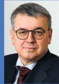
Ярослав Иванович Кузьминов, ректор Высшей школы экономики, один из лидеров российских образовательных реформ

В ГУ-ВШЭ исследования в области образования ведутся в разных институтах, лабораториях, на разных факультетах. В этом буклете представлены наиболее активные академические группы в этой области и их проекты.