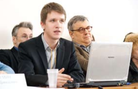
На базе ИНИИ действует регулярный научный семинар, на котором часто выступают специалисты из университетов США и Европы.