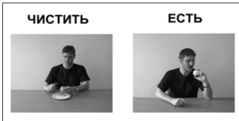
Рис.1. Пример стимульного материала Эксперимента 1. Экспериментатор: «Здесь мужчина чистит яблоко». Ожидаемый ответ испытуемого: «А здесь мужчина ест яблоко».

эксперимента предъявлялось 80 проб, содержащих 20 целевых глаголов в четырех обозначенных условиях. В эксперименте приняли участие семь пациентов с афазией небеглого типа (эфферентной и/или динамической), семь пациентов с афазией беглого типа (сенсорной и/или акустико-мнестической) и семь здоровых испытуемых.