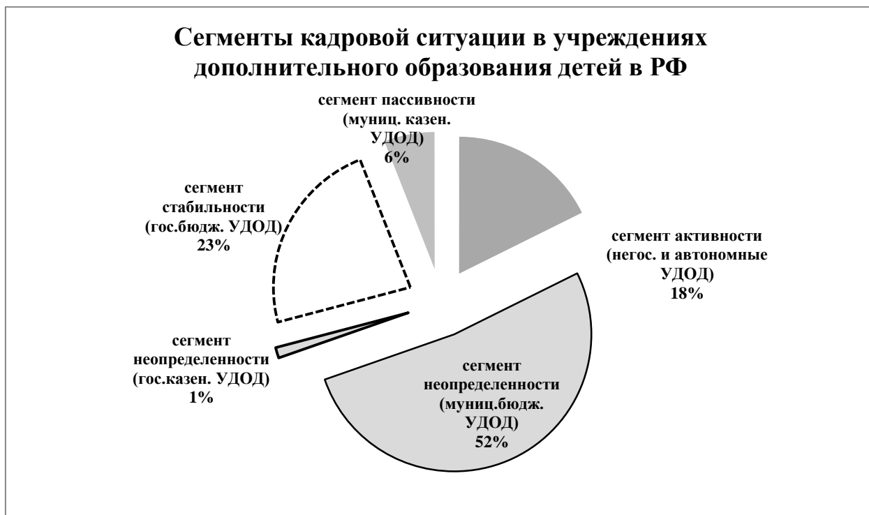
Рисунок 3. Сегменты кадровой ситуации в учреждениях дополнительного образования детей

Сегмент стабильности , по нашему мнению, включает государственные бюджетные учреждения ДОД. Хотя кадровая ситуация по основанию «государственные учреждения» значительно лучше, чем по основанию