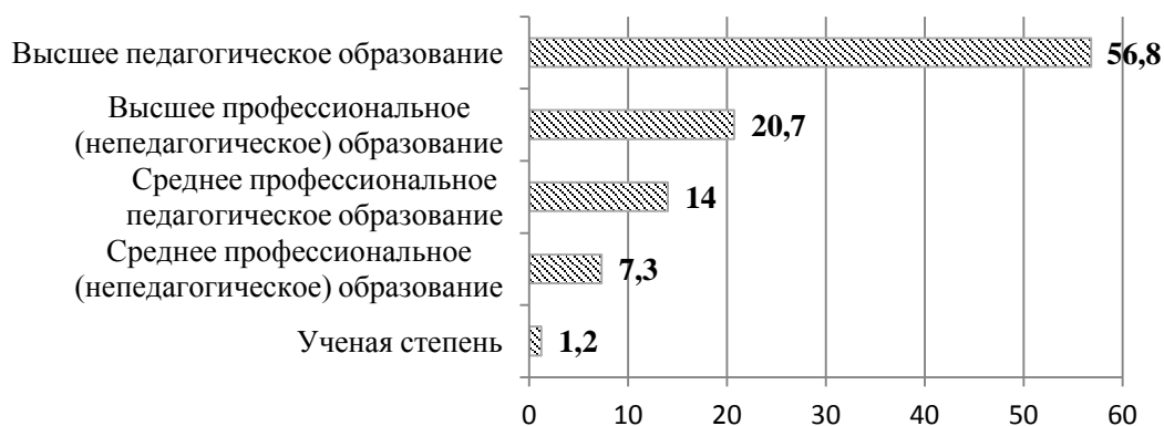
Рисунок 1. Вопрос: Доля педагогов с различным уровнем образования (Ответы руководителей УДОД, 2012 г., проценты)

Наличие среди педагогов существенной доли работников, не имеющих педагогического образования, нельзя оценивать однозначно негативно, как это традиционно делается применительно к ситуации в дошкольном и общем образовании. Поли-профессиональный кадровый состав УДОД обеспечивает особые условия для освоения специфических компетенций (ребенок встречается взрослого – специалиста в определенной области практики или науки), а также позволяет избежать избыточного дидактизма, неадекватного специфики дополнительного образования детей (навязывание норм, оценочный подход к деятельности детей и т.д.).