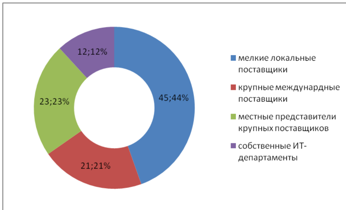
Рис. 3. Распределение объявлений по виду поставщиков ИТ-услуг

Однако зачастую компании выступают в поддержку собственной, уже сформированной, инфраструктуры. В таких случаях менеджмент считает более целесообразным развитие информационных технологий силами собственных ИТ-подразделений, чем аутсорсинг процессов автоматизации. Распределение объявлений по видам поставщиков представлено на рис. 3.