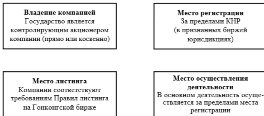
Рис. 2. Особенности компаний «red chips»