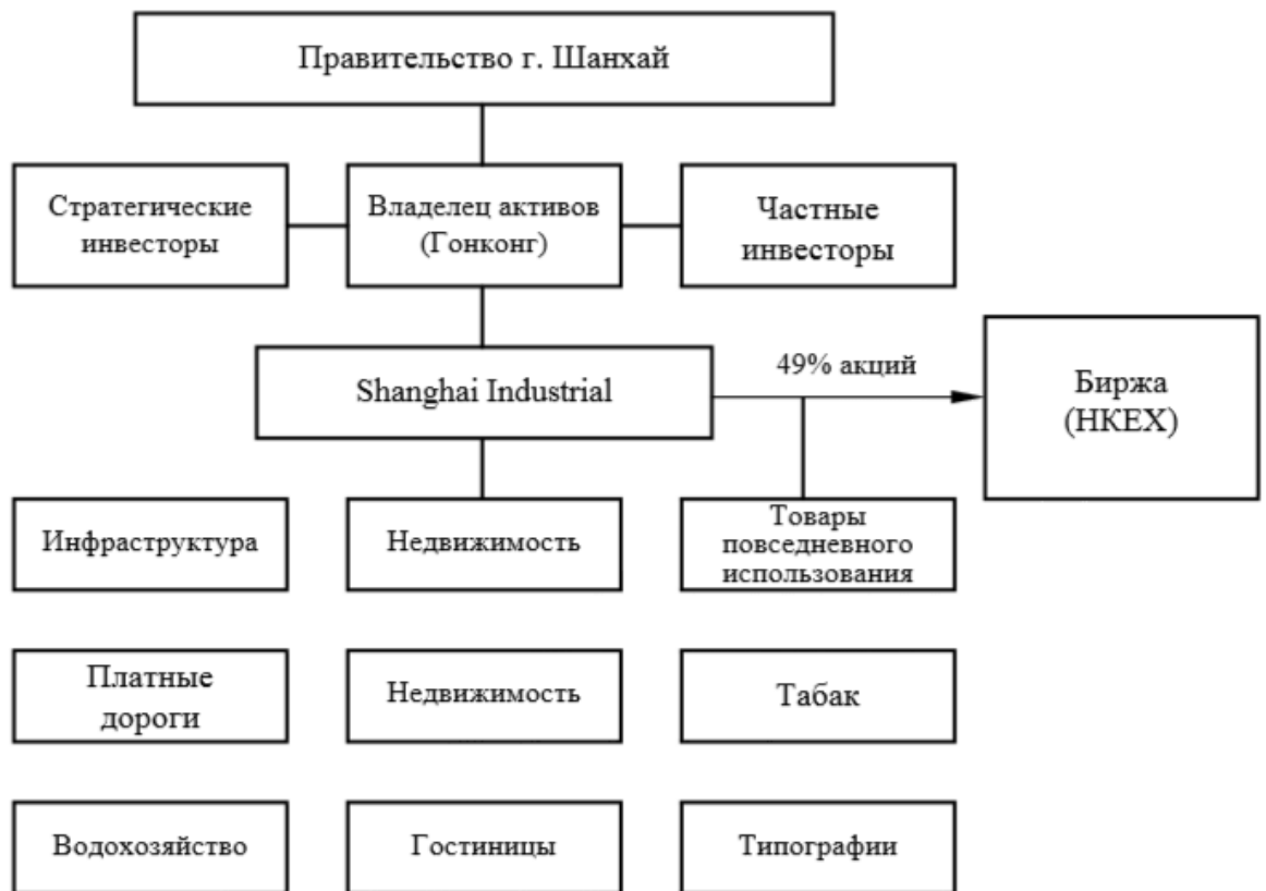
Рис. 3. Структура холдинга «Shanghai Industrial»