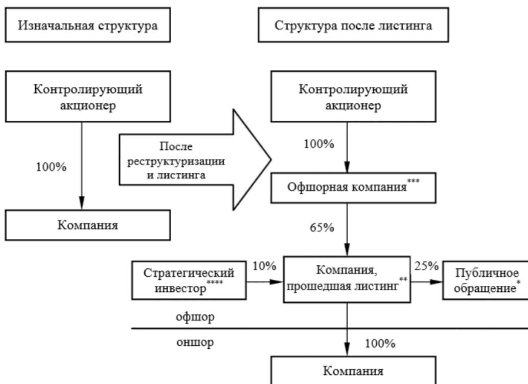
Рис. 1. Корпоративная структура «red chips»