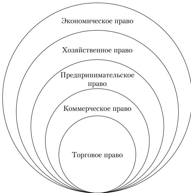
Рис. 1.1. Соотношение дефиниций предпринимательского права

При буквальном и лексическом толковании различных обозначений отрасли можно предположить картину (рис. 1.1), при которой экономическое право включает в себя любые нормы права, связанные с производством, распределением, обменом и потреблением. Хозяйственное право регулирует любые производственно-хозяйственные отношения. Предпринимательское право ограничивается отношениями, связанными с извлечением прибыли, а коммерческое право — теми же отношениями, только с участием коммерсантов. Торговое право охватывает отношения в сфере реализации (торговли) продукции (товаров, работ и услуг) на рынке.