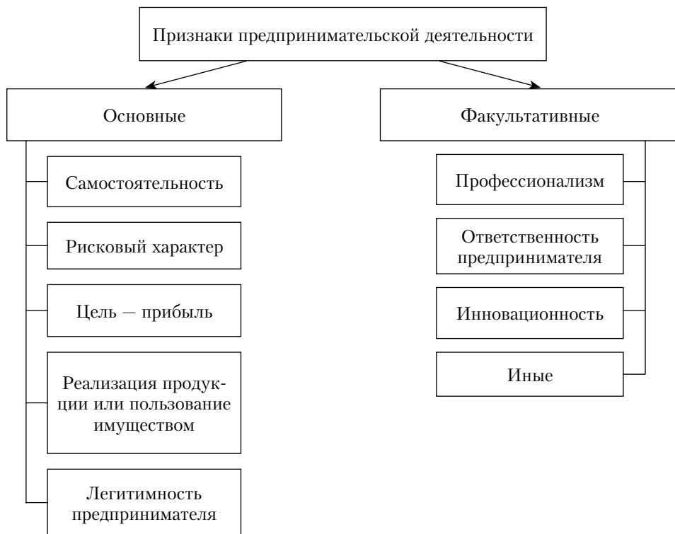
Рис. 1.3. Виды признаков предпринимательской деятельности

правовую форму предпринимателя, которая, в свою очередь, предопределяет правовой режим имущества субъекта, виды и размер ответственности по предпринимательско-правовым обязательствам, объем прав участников хозяйствующего субъекта и т.д.