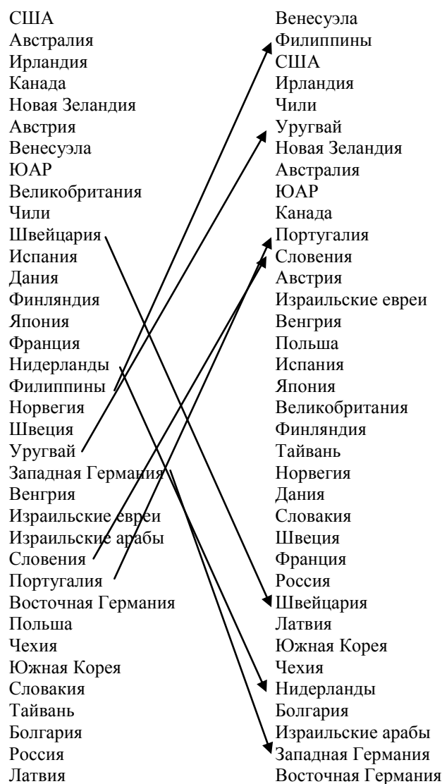
Рисунок 3 – Иерархии стран по факторному индексу общей национальной гордости (слева) и по прямой оценке респондентом общей гордости за свою страну (справа); страны отсортированы от наибольшего к наименьшему значению отдельно по каждому показателю гордости

К странам противоположного типа, с более высокими относительными позициями по нормативной гордости, чем по когнитивно-рациональной, относятся Филиппины, Португалия, Словения и Уругвай. Подобный разрыв указывает на то, что сознание населения этих стран подвержено сильному влиянию норм патриотизма и национальной гордости. Эти нормы приводят к завышению оценок национальной гордости, передаваемые в формате прямых высказываний, по сравнению с высказываниями о гордости, которые базируются на реальных достижениях. Именно к этой категории стран, хотя и с относительно меньшим разрывом между уровнями рациональной и нормативной гордости, относится и Россия.