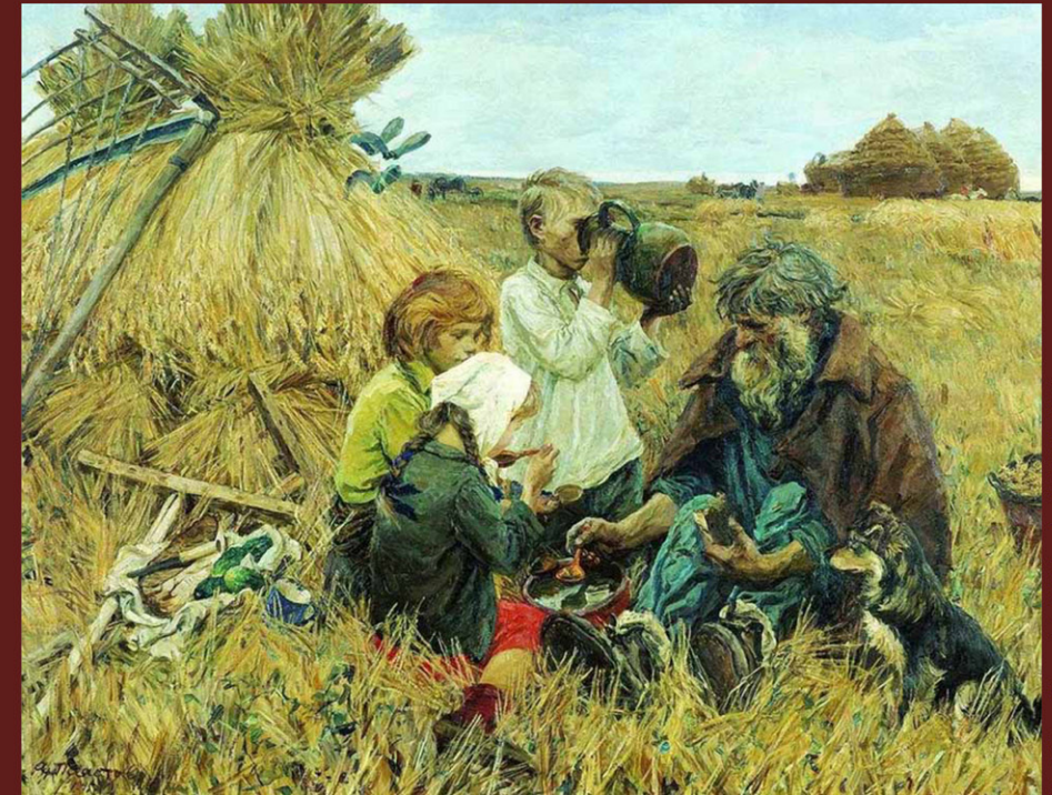
La Moisson Plastov Arkadi Aleksandrovitch (1893-1972)