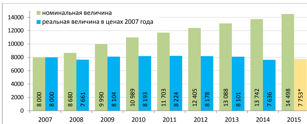
а) единовременное пособие при рождении (усыновлении) ребенка