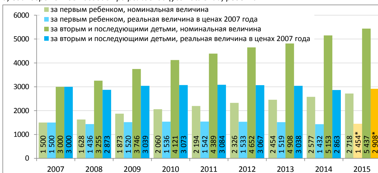
б) минимальный размер ежемесячного пособия по уходу за ребенком