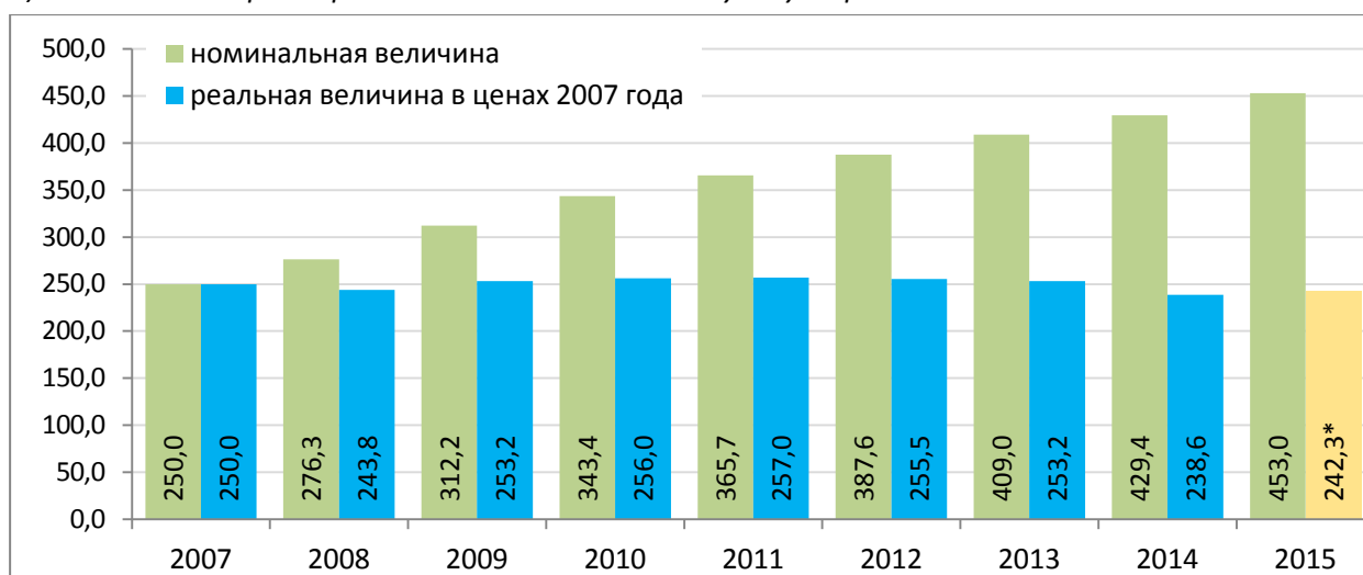
в) государственный сертификат на материнский (семейный) капитал, тыс. руб.