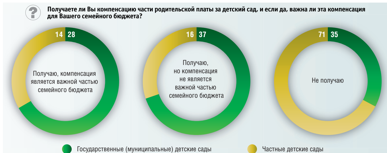
Рис. 1. Получение компенсации части родительской платы за детский сад (в процентах от численности ответивших)

Среди родителей, пользующихся услугами частных детских садов, только треть получают компенсацию родительской платы, причем лишь для 14% опрошенных она представляется важной частью семейного бюджета (рис. 1).