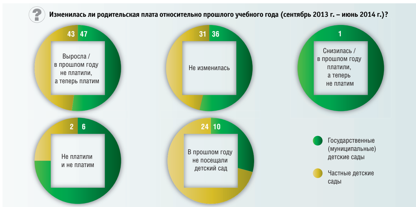
Рис. 2. Изменение родительской платы в 2014–2015 учебном году (в процентах от численности ответивших)

Большинство опрошенных, чьи дети посещают частные детские сады, не имеют дополнительных расходов. Респонденты, указавшие на их наличие, чаще всего называли такие статьи, как подарки воспитателям (20%) и закупка книг или игрушек для детского сада (12%) (рис. 3).