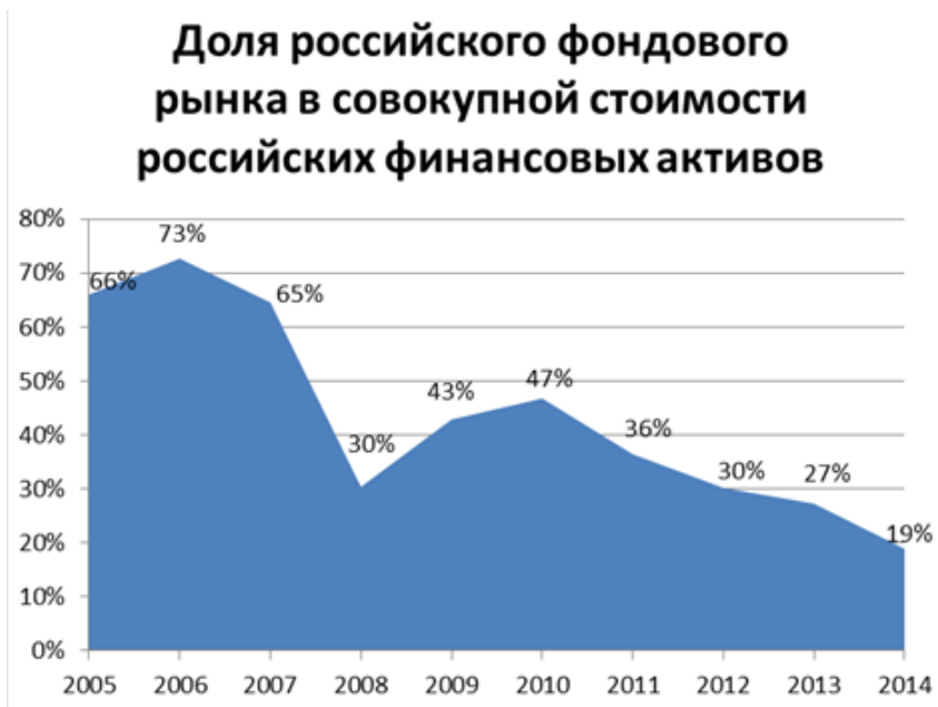
Рис. 3. Доля фондового рынка в совокупной стоимости финансовых активов (данные Московской биржи и Центрального банка РФ)

В последние 5 лет происходило последовательное ухудшение показателей российского фондового рынка – снижался объем торгов на бирже, уменьшалось число эмитентов, падала доля российского фондового рынка по отношению к мировым и развивающимся рынкам, уменьшался коэффициент оборачиваемости (отношение объема торгов к капитализации), снижалось число эмитентов.