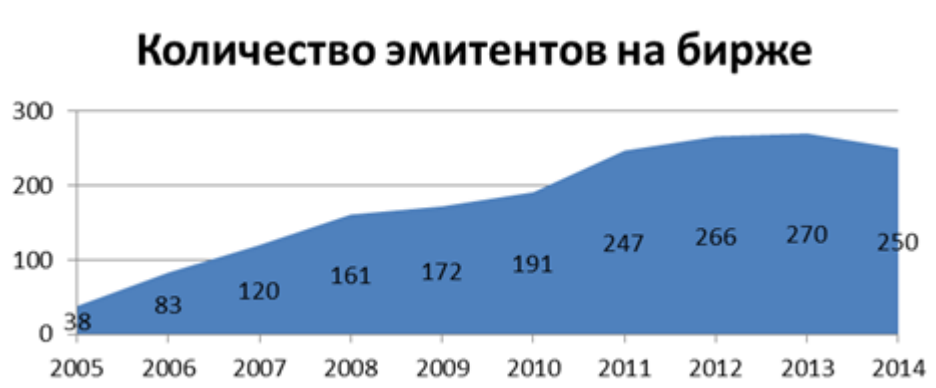
Рис. 4. Количество эмитентов на Московской бирже (данные Московской биржи)

В последние 5 лет происходило последовательное ухудшение показателей российского фондового рынка – снижался объем торгов на бирже, уменьшалось число эмитентов, падала доля российского фондового рынка по отношению к мировым и развивающимся рынкам, уменьшался коэффициент оборачиваемости (отношение объема торгов к капитализации), снижалось число эмитентов.