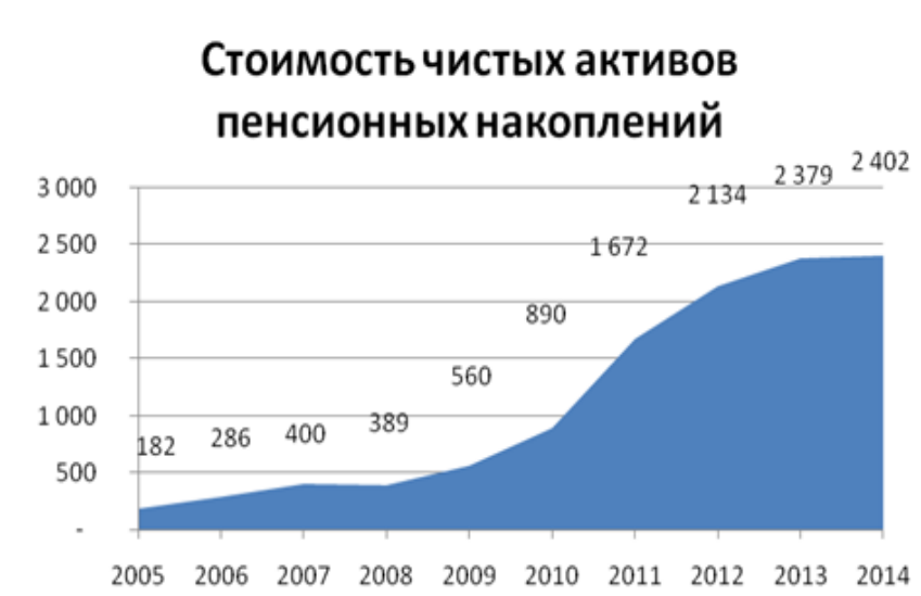
Рисунок 7. Стоимость чистых активов пенсионных накоплений (данные компании Cbonds)

при этом непонятна дальнейшая судьба пенсионной реформы. Заморозка пенсионных накоплений делает невозможным прирост активов. С другой стороны, доля акций в портфеле активов пенсионных фондов составляла в 2014 году всего 6,9%, а основная доля приходилась на депозиты.