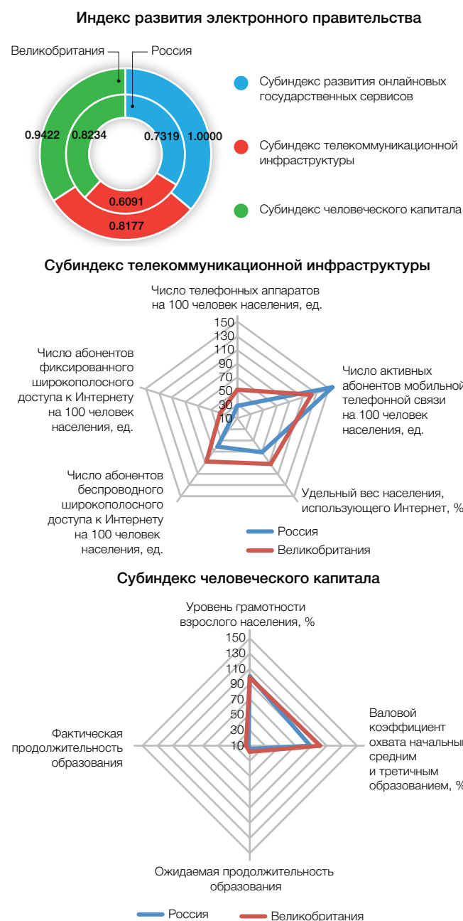
Рис. 2. Субиндексы и показатели Индекса развития электронного правительства: 2016

Индекса развития электронного правительства. И этому есть множество причин.