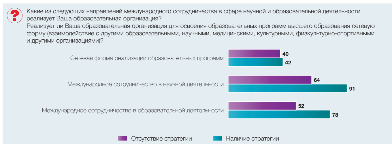
Рис. 3. Международное сотрудничество и сетевая форма реализации образовательных программ и наличие стратегии развития (в процентах от численности ответивших)

Существуют ряд причин, по которым те или иные вузы за последние 5 лет разработали и приняли стратегию развития. Главная из них, по мнению ректоров, – стимулирующая государственная политика. Примерно каждый третий опрошенный указал, что принятие это-