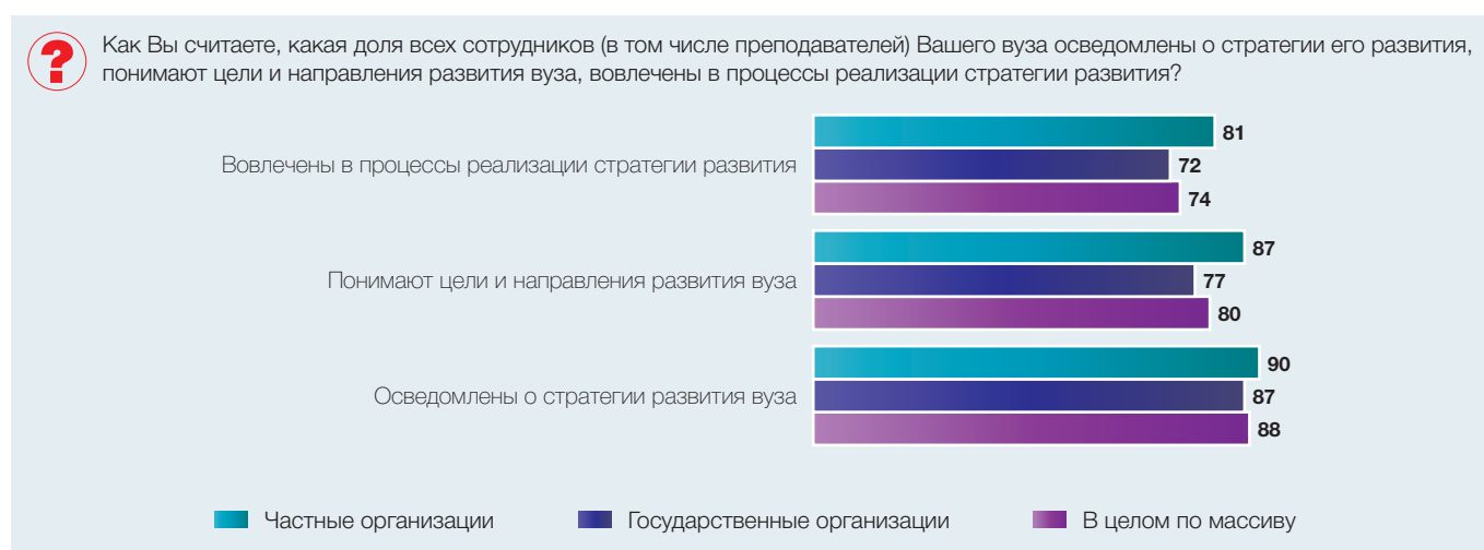
Рис. 8. Осведомленность, вовлеченность и понимание стратегии развития среди сотрудников вузов (средняя доля, в процентах от численности ответивших)

нее вовлечены и в большей степени понимают цели развития своей организации, чем в государственных (рис. 8).