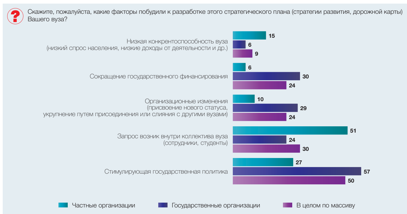
Рис. 7. Причины разработки и принятия стратегии развития или дорожной карты (в процентах от численности ответивших)

вуза, чуть меньше. Примерно в трех четвертях обследованных вузов сотрудники вовлечены в реализацию стратегии. Однако в частных вузах сотрудники актив-