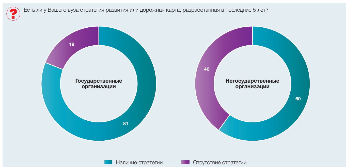
Рис. 1. Наличие стратегии развития в государственных и негосударственных образовательных организациях высшего образования (в процентах от численности ответивших)

В-третьих, наличие стратегии развития скорее характерно для тех вузов, где реализуются различные