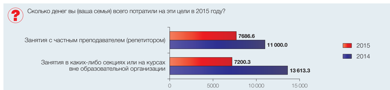
Табл. 5. Расходы студентов на нужды учебного заведения по видам (% от численности ответивших)

Были ли у Вас, Вашей семьи в августе и сентябре 201X г. расходы в денежной или натуральной форме на следующие нужды учебного заведения, в котором Вы учитесь?