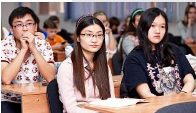
Курсы по русскому языку как иностранному на базе Университета