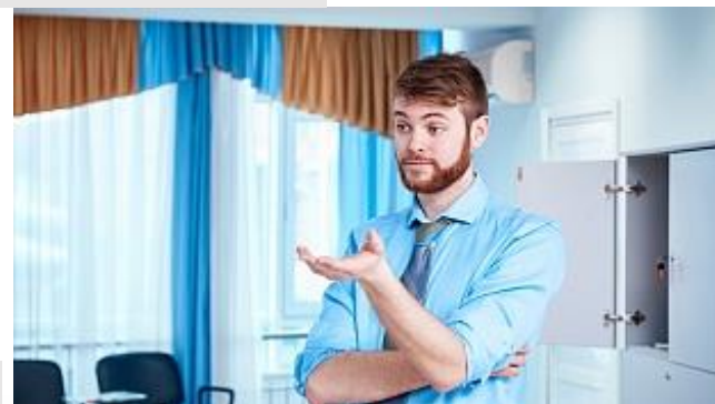
Отдел сервисов поддержки иностраннных студентов и специалистов