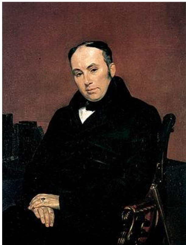
Василий Андреевич Жуковский (1873-1852)