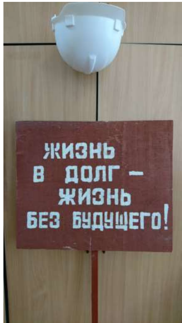
Фото сделаны в редакции газеты «За Тяжелое Машиностроение» (Уралмаш), июнь, 2017 г.