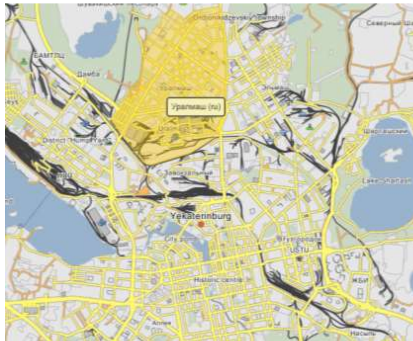
Микрорайон Уралмаш на карте г. Екатеринбурга выделен желтым цветом

Численность Орджоникидзевского района ежегодно растет и составляет 287,87 тыс. человек на 01.01.2017, из них более половины – жители микрорайона Уралмаш