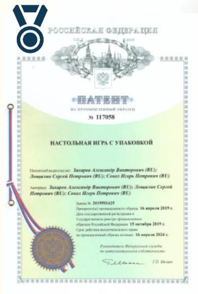
Патент № 117058