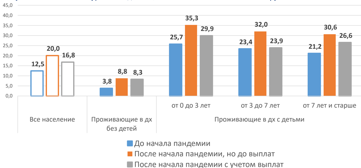
Рисунок 2 – Изменение уровня бедности, % от численности населения группы