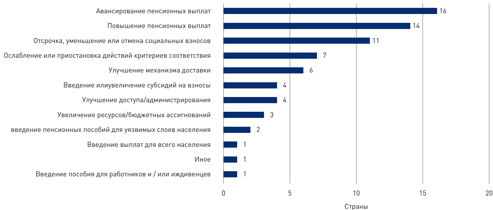
Рис. 2 Меры поддержки населения в рамках пенсионных систем по числу стран

Источник: расчеты авторов по данным МОТ 42