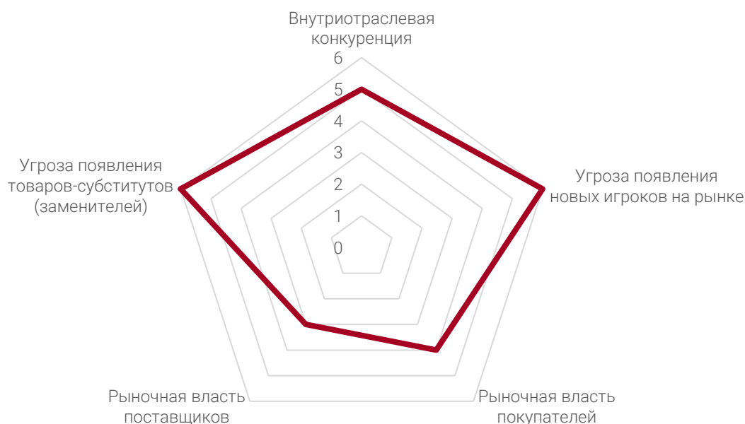
Рисунок 4. Результаты анализа 5 конкурентных сил М. Портера (лепестковая диаграмма)