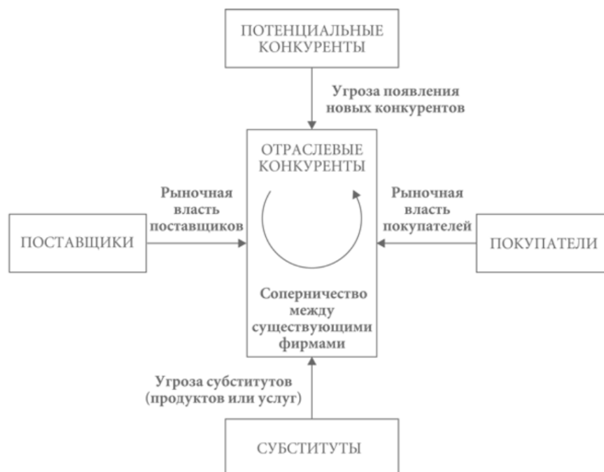
Рисунок 3. Пять конкурентных сил М. Портера 10

Именно эти пять сил определяют степень привлекательности той или иной отрасли, а их анализ позволяет более четко понять отраслевой контекст, в котором компания осуществляет свою деятельность, оценить конкурентное пространство во всех перспективах. Кроме того, данный инструмент позволяет изучить привлекательность потенциально новых отраслей, также оценить стратегическую позицию компании на рынке.