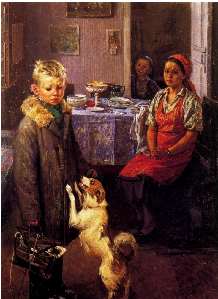
Ф.П. Решетников «Опять двойка!», 1951 г.

Задание 2. Проанализируйте изображение и выполните задания «3)» – «4)»