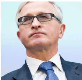
Президент Шохин А.Н.