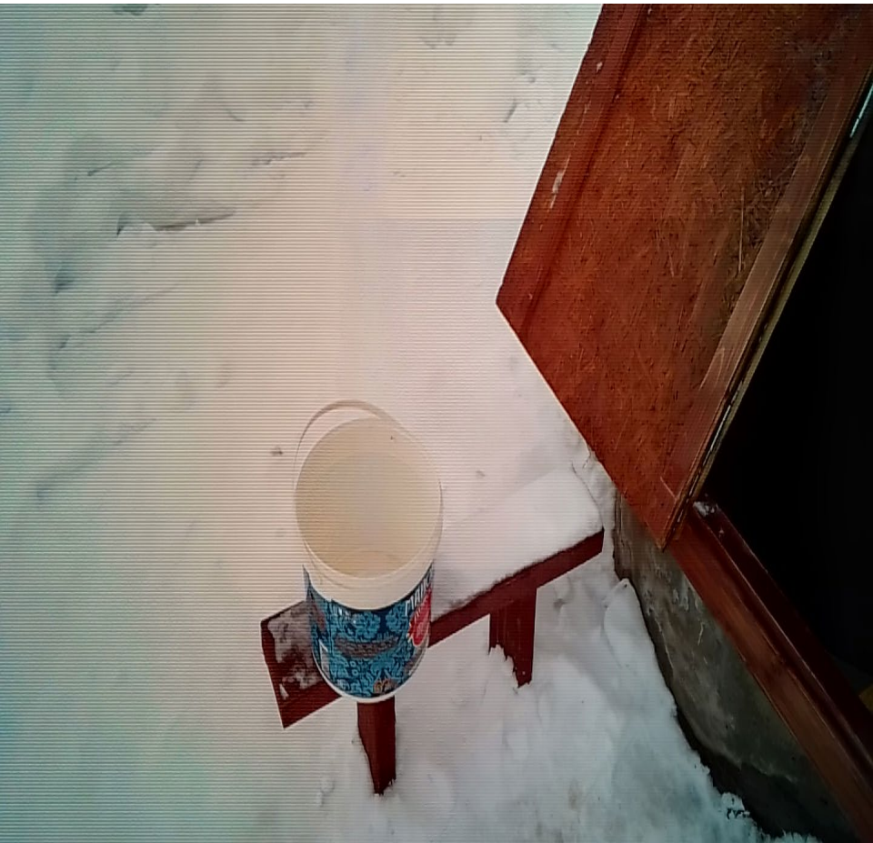
Колодец в селе. Ленинградская область