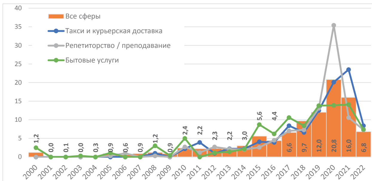
Рисунок 3. Распределение включенных в платформенную занятость по году входа на онлайн-платформы, общая динамика и показатели по отдельным видам деятельности, %