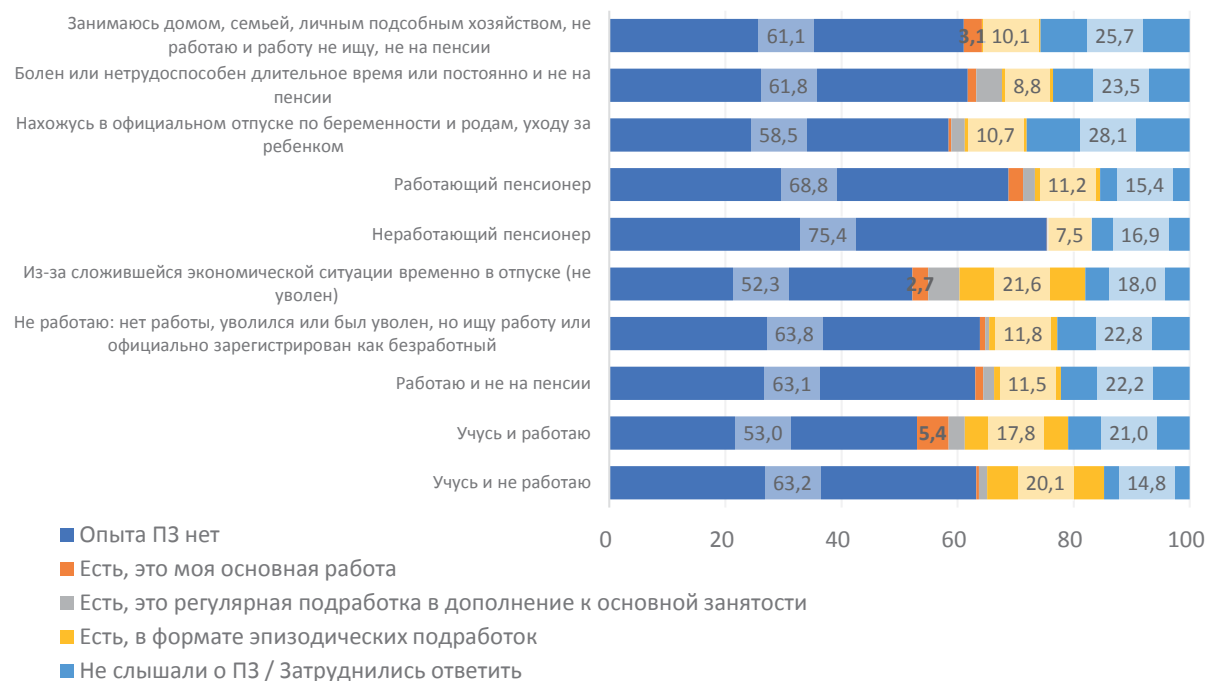
Рисунок 2. Доля лиц, включенных в платформенную занятость в разном формате, в разрезе основного занятия, %