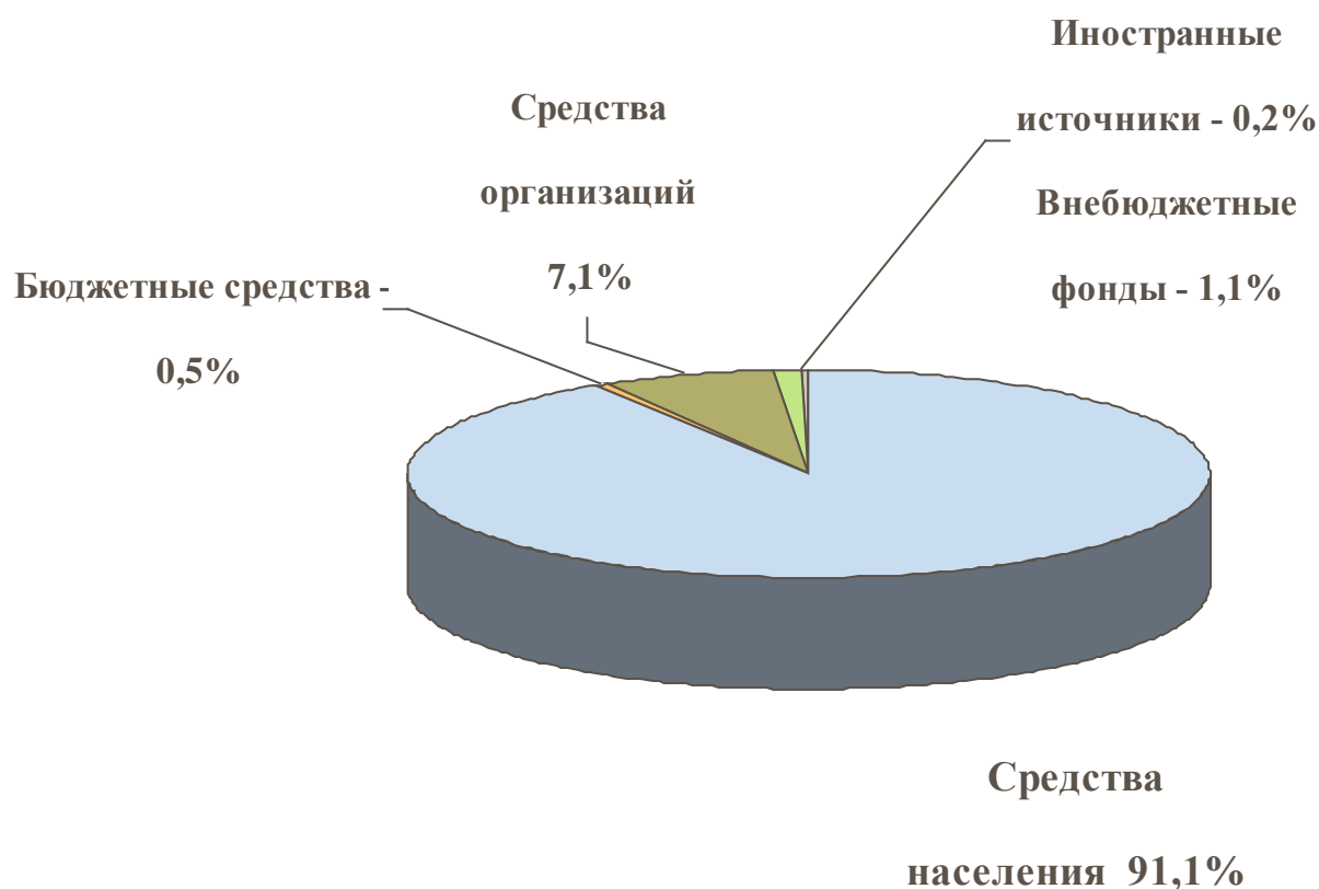
Рис. 2. Структура средств негосударственных высших учебных заведений по источникам финансирования (в %): 2009г. 7

Наращивание государственных ассигнований в российскую образовательную систему постоянно сталкивается с жесткими бюджетными ограничениями. Однако у домохозяйств тоже существуют бюджетные ограничения, и повышение платы за обучение в перспективе может привести к сокращению количества студентов. Поэтому одна из задач состоит в том, чтобы найти новые источники финансирования университетов, развивая их взаимодействие с бизнесом, благотворительными фондами и собственными выпускниками. Сегодня участие коммерческих организаций в финансировании российского высшего образования является недостаточным. В 2009г. средства организаций в структуре средств государственных высших учебных заведений составляли 15,3%, а в структуре средств негосударственных вузов – только 7,1% (рис. 1 и 2).