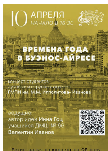
Рис. 3. Афиша (фото из личного архива автора)