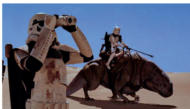
Рис. 1. Кадр из фильма «Звездные войны. Эпизод IV: Новая надежда»