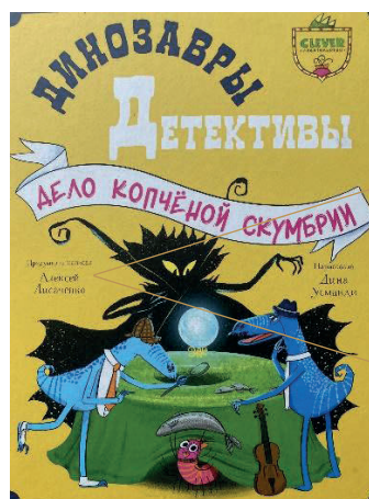
Рис. 5. Обложка книги «Динозавры-детективы. Дело копченой скумбрии», 2024

Порой и сам автор считает необходимым подчеркнуть, что идея — тоже его («придумал и написал», рис. 5).