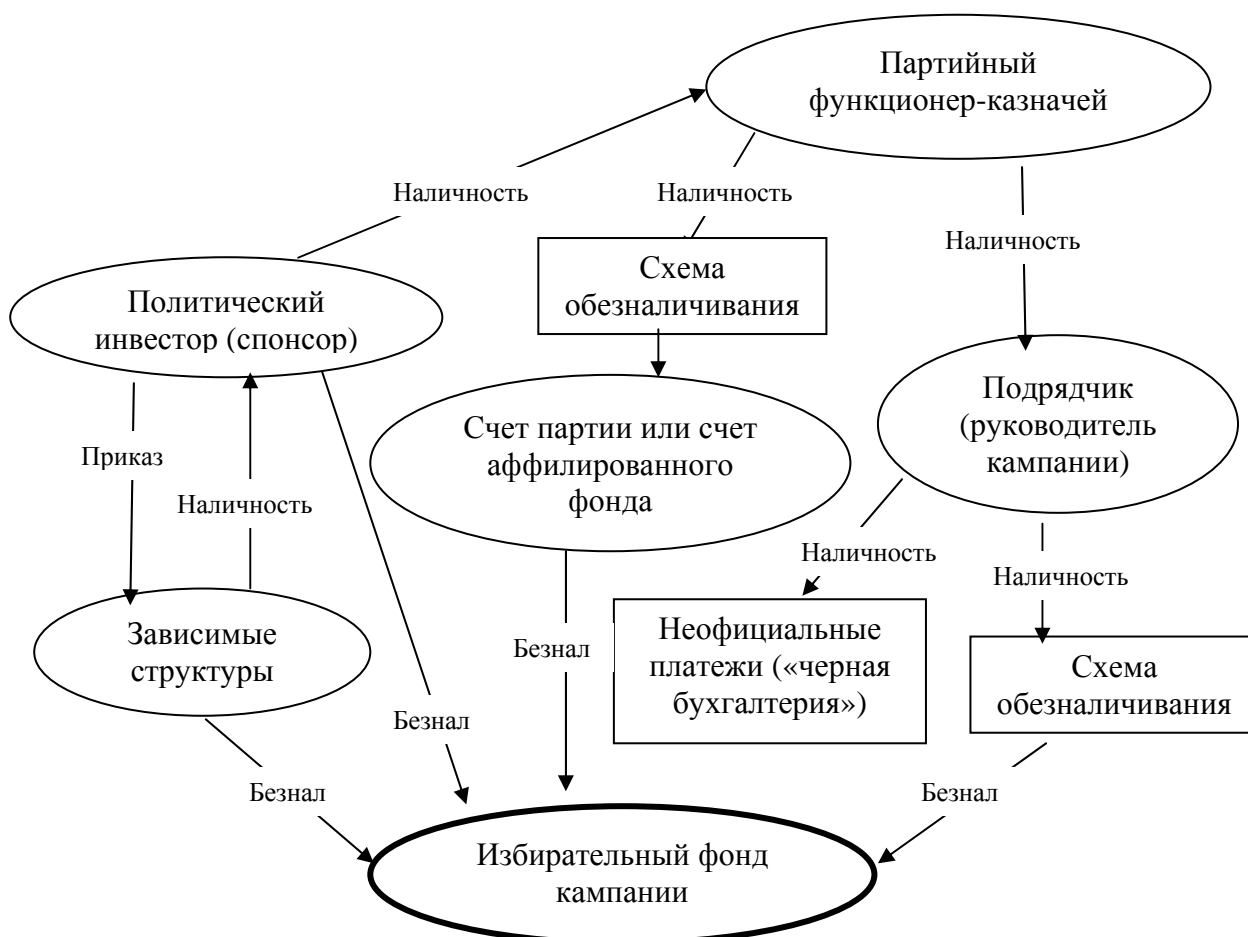
Рис. 3. Механизм мобилизации средств на избирательную кампанию кандидатов по партийным спискам

У представителей «партии власти» есть еще одно существенное преимущество: их партийные списки, как правило, продвигают или даже лично возглавляют губернаторы (по крайней мере, они охотно это делали до того, как их начал назначать президент). Это означает ровно то, что вся экономика региона относится в терминах нашей схемы к «зависимым» предприятиям, на которые распространяется негласный приказ о спонсировании выборов.