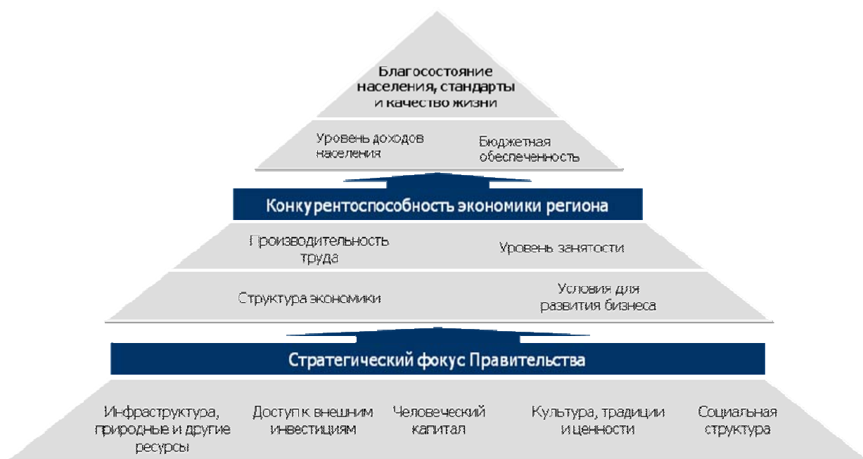
Рис. 1 Стратегические цели власти

занятости населения и вовлечения его в наиболее производительный труд в различных секторах экономики.