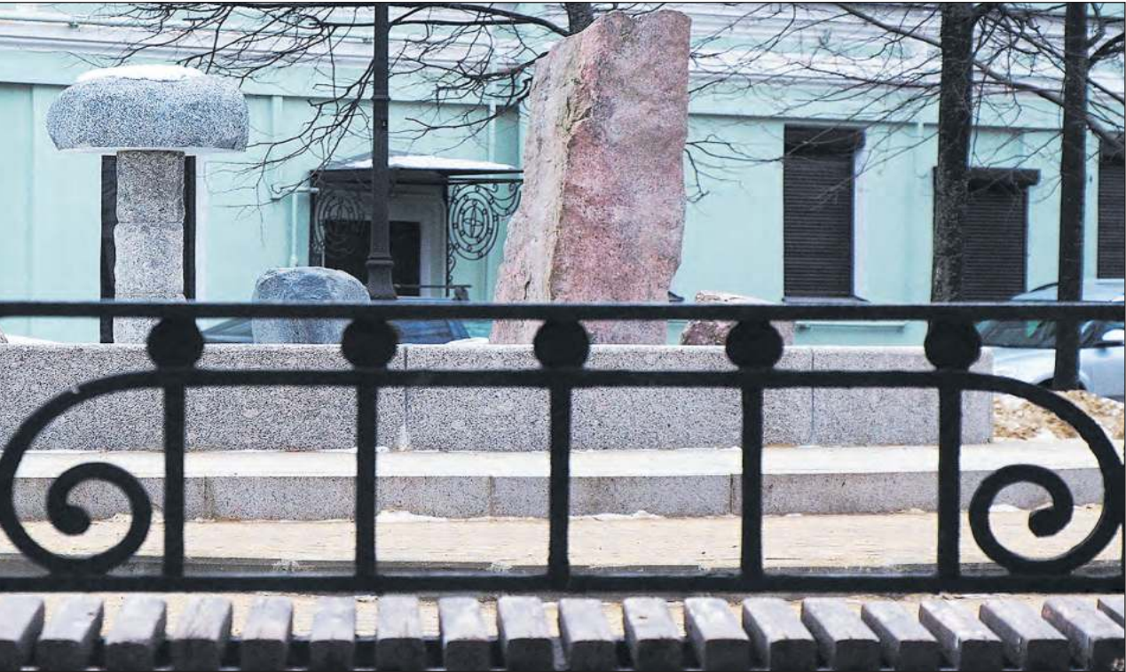
Сегодня в сквере Соловьева-Седого явно не хватает деревьев.

Со своей стороны, муниципальные образования заявили о планах благоустроить 178 дворов. За счет городского бюджета.