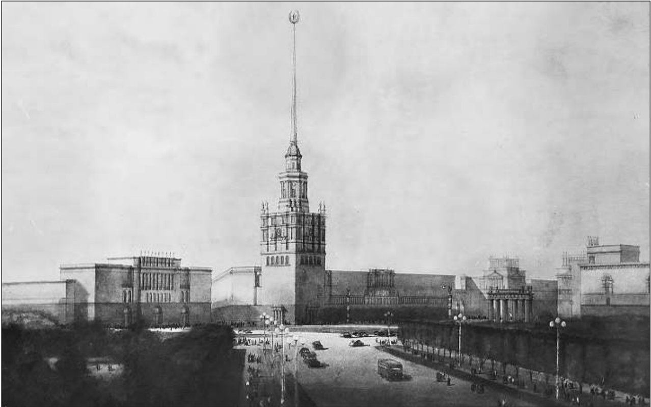
Один из конкурсных проектов будущей площади у Средней Рогатки (ныне площадь Победы), представленный архитектором Сергеем Сперанским. Он предлагал также установить там Московские ворота, которые были разобраны еще в середине 1930-х годов.