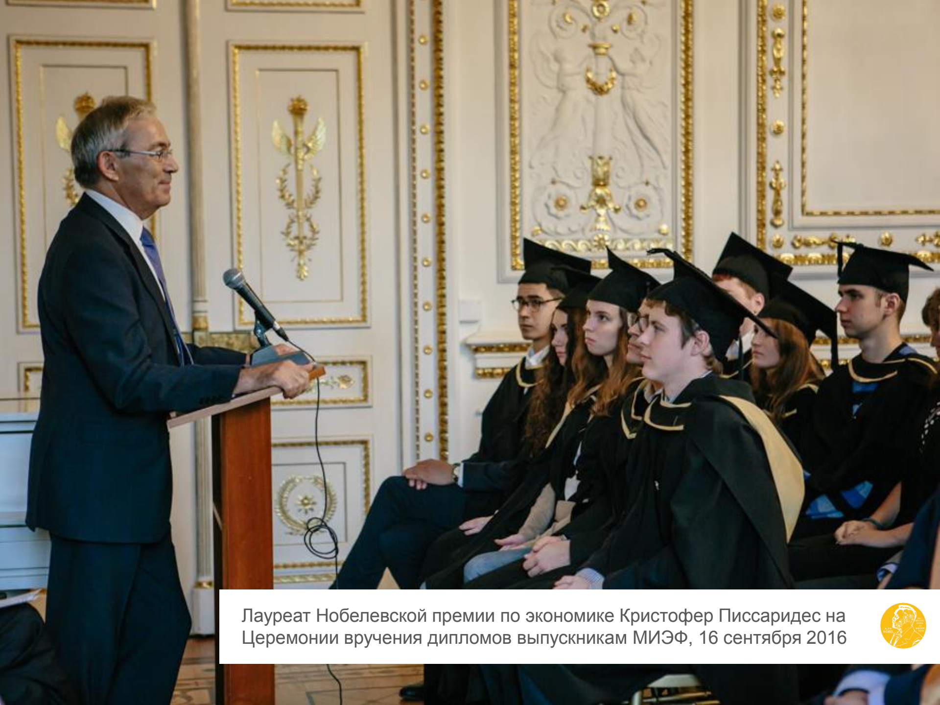
Лауреат Нобелевской премии по экономике Кристофер Писсаридес на Церемонии вручения дипломов выпускникам МИЭФ, 16 сентября 2016