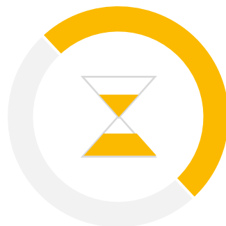
Системно-деятельностный подход – методологическая основа Стандарта