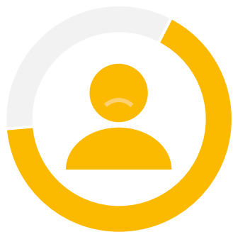
«Портрет выпускника школы»