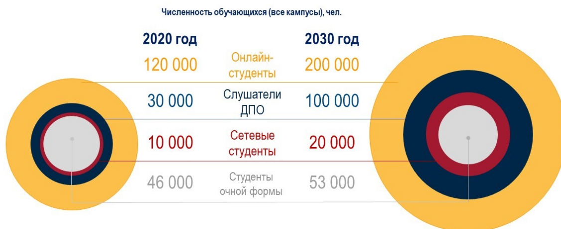
Рис. 2. Динамика изменения контингента обучающихся НИУ ВШЭ в 2020–2030 гг.

НИУ ВШЭ не заинтересован в быстром расширении численности обучающихся на основных образовательных программах (см. рис. 2) в силу кадровых и инфраструктурных ограничений, а также чтобы не снижать достигнутый уровень качества приема (для бакалавриата в Москве и Санкт-Петербурге это 95 из 100 баллов по бюджетному приему и 85 из 100 баллов по платному приему). Рост контингента обучающихся будет осуществляться за счет: (а) программ дополнительного образования; (б) сетевых программ, в том числе программ микростепеней НИУ ВШЭ с другими российскими и зарубежными вузами; (в) студентов онлайн-программ по всему миру. Такая политика сохранит от «размывания» бренд НИУ ВШЭ, усилит образовательное влияние университета и увеличит его доходы.