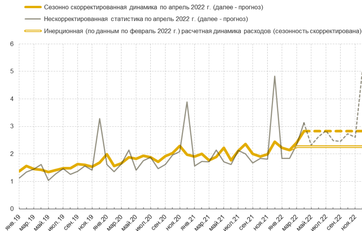
Рис. 3. Динамика расходов федерального бюджета (фактическая и прогнозная, с оценкой эффекта от наращивания в марте-апреле), трлн руб.

Источник: Минфин, расчеты и оценки Института «Центр развития» НИУ ВШЭ.